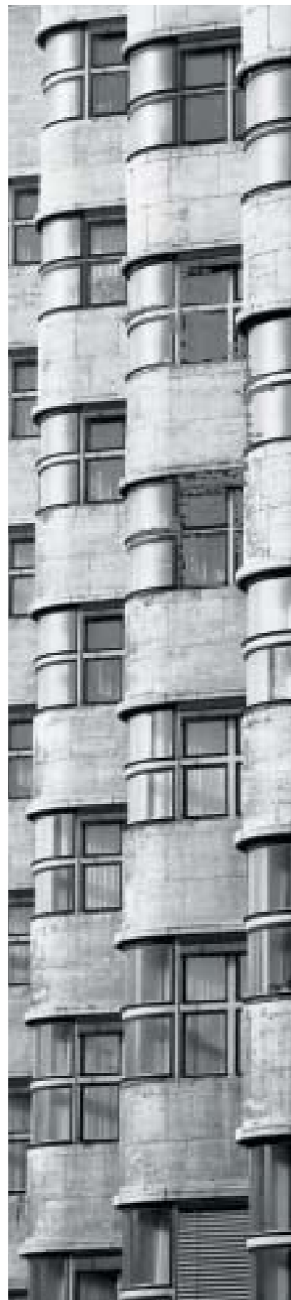
Ohne SISTAN: Reflexionen ohne Glas. Der entstandene Silberspiegel hat das Motiv zerstört.