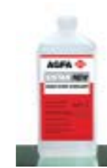
SISTAN schützt vor den Folgen der Oxidation